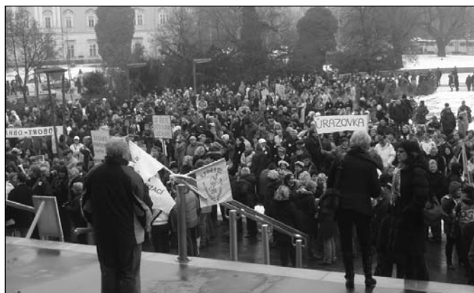
Téměř tři tisíce lidí přišlo před Janáčково divadlo v Brně protestovat proti vládním škrťům.