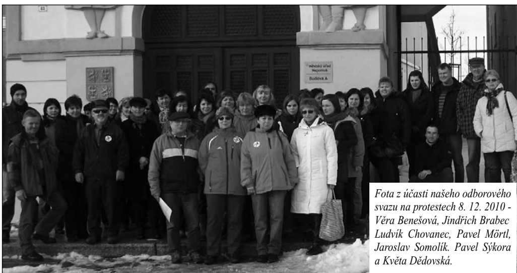
Před Městským úřadem v Nepomuku se sešli odboráři a zaměstnanci úřadu i úřadů okolních obcí.