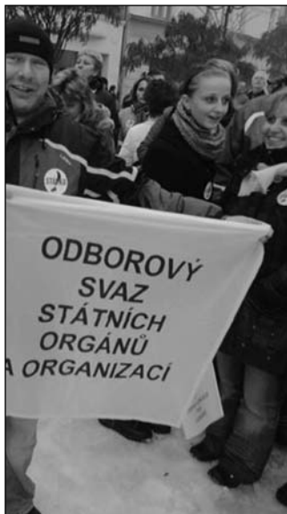
Demonstrovali jsme také v Ostravě.