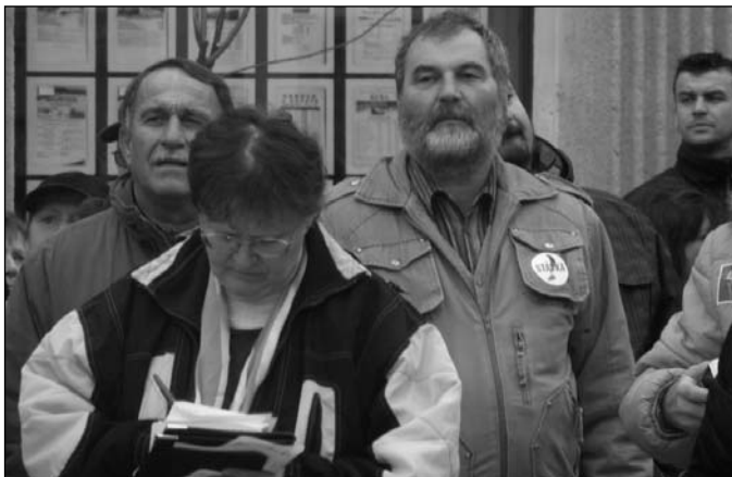
Občanští pracovníci policie v Hradci Králové.