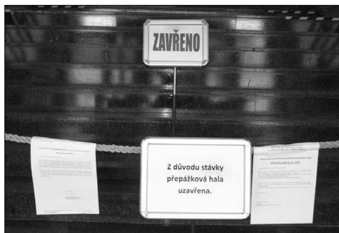
Řada úřadů zůstala zavřena nebo fungovala v omezené míře. Toto foto je z budovy katastrálních úřadů v Praze v den stávk.