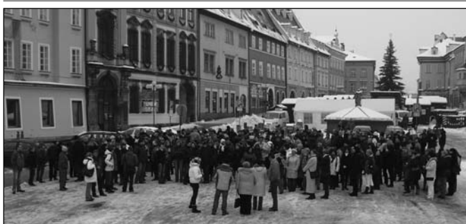
Protestní shromáždění proti vládním škrtům a změnám v odměňování v Chebu. Fota z dalších míst na straně 2 a 3.