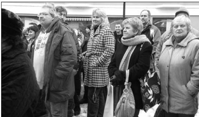
Zástupci České správy sociálního zabezpečení v Hradci Králové.