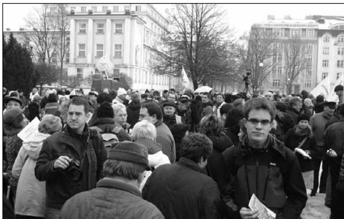
Účastníci protestního shromáždění v Praze na Palackého náměstí.