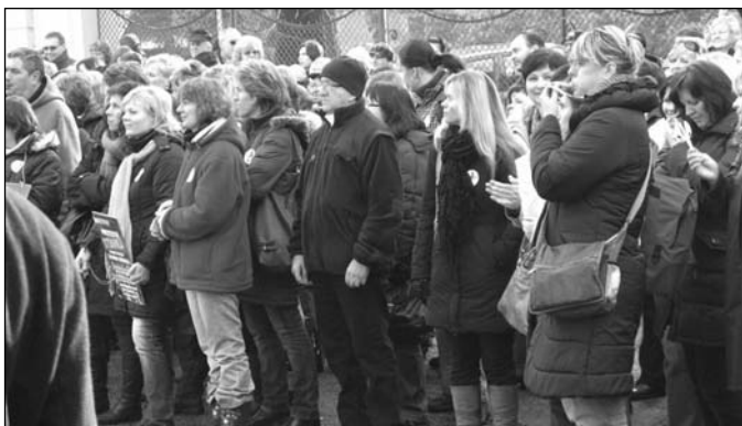
Na protestním mítinku v Českých Budějovicích.