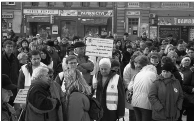
Demonstrace v Plzni.