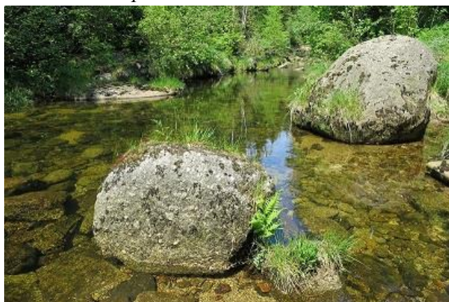
průzračná voda v Kamenici