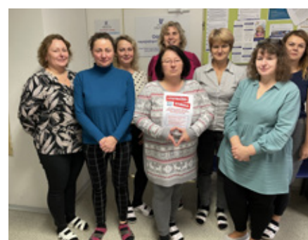
Úřad práce Odry