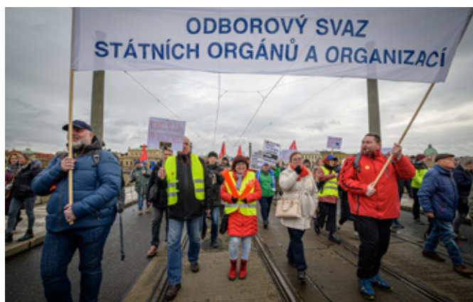
V pochodu na Malostranské náměstí nemohl náš svaz chybět.