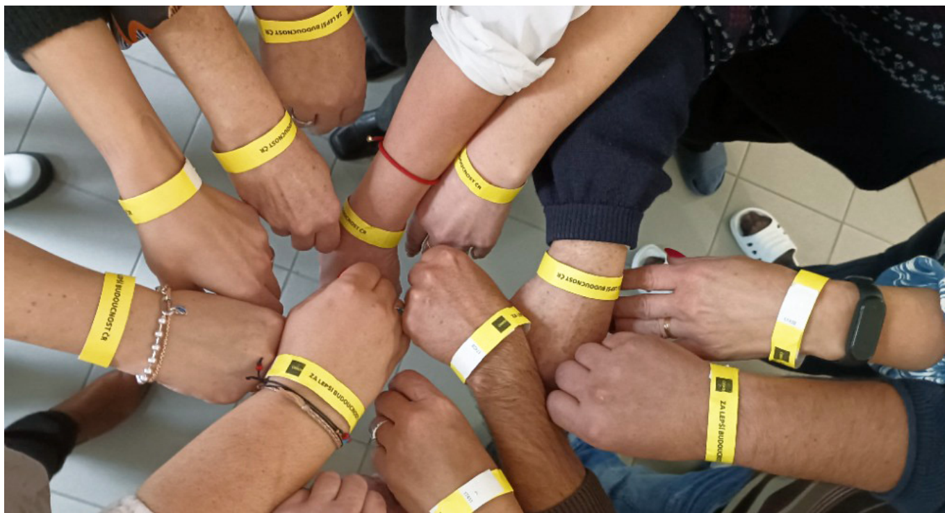
Městský úřad Prachatice