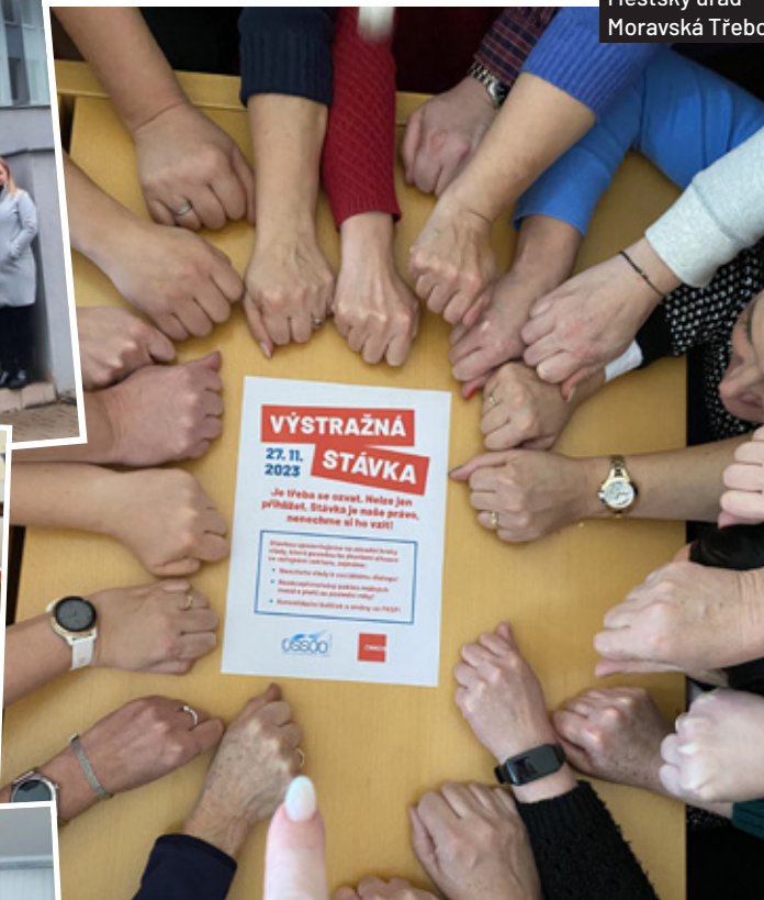
Městský úřad Moravská Třebová