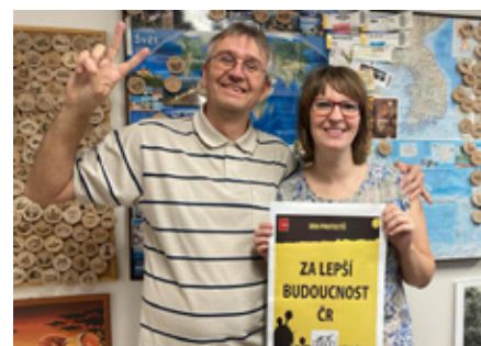
Katastrální úřad Prachatice

Řada reakcí na Den protestů přicházela na svaz i po jeho skončení, včetně některých kritických připomínek. Spolu s dalšími svazy v rámci ČMKOS nyní průběh a výsledky celé akce vyhodnocujeme. A jedno je jisté – Dnem protestů aktivita