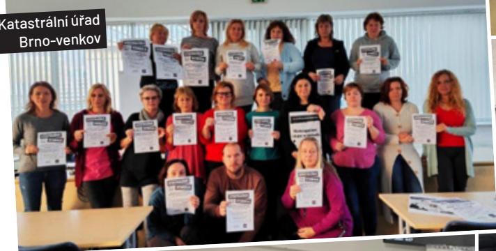
Katastrální úřad Brno-venkov