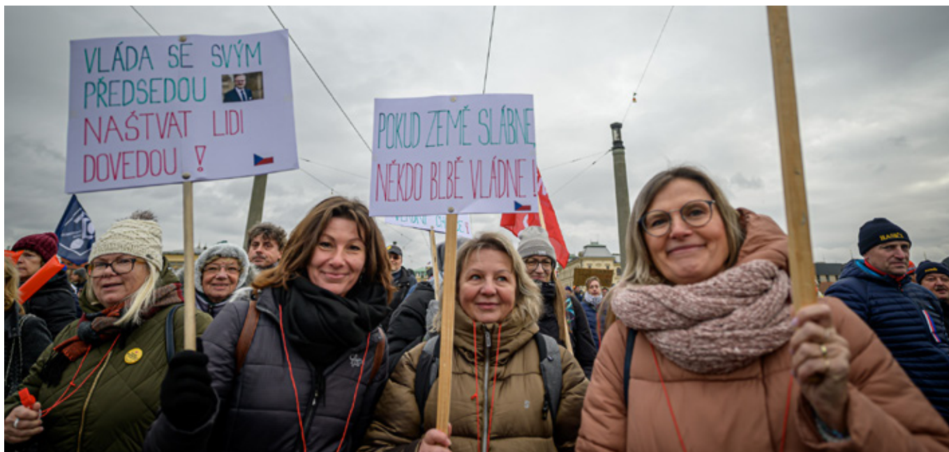
Členky a členové našeho svazu na demonstraci v Praze.