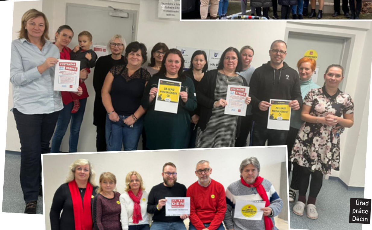
Úřad práce Děčín