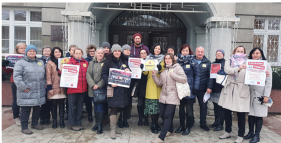
Městský úřad Český Těšín

Všem, kteří se akcí zúčastnili nebo je podpořili, jménem vedení svazu upřímně děkujeme. Není jednoduché projevit nespokojenost a zejména projevit ji veřejně. O to více si zapojení každého z vás vážíme a oceňujeme jej. Jsme v tom společně, dodáváme si odhodlání navzájem a jsme připraveni v našem společném úsilí pokračovat!